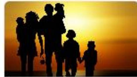
Servizi alla famiglia