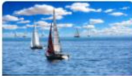
Servizi fiscali per parenti e amici