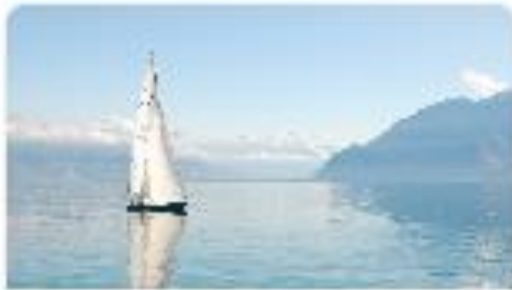
Servizi fiscali per me

SERVIZI ALLA FAMIGLIA: in questa sezione ( se prevista dalla convenzione aziendale ) trovi i servizi di patronato che puoi acquistare tramite il portale EasyLife